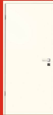
Weißlack ähnl. 9010 CPL gefälzt, Türblatt und Zarge mit 2 mm Designkante