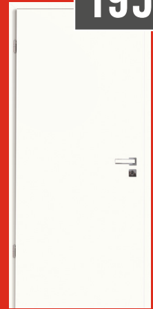
Weißlack ähnl. 9016 CPL gefälzt, Türblatt und Zarge mit 2 mm Designkante