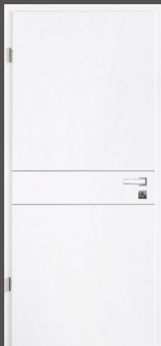
Türblatt mit 2 Querrillen Lack ähnl. RAL 9010, Rundkante Zarge Weißlack ähnl. 9010 CPL mit 2 mm Designkante