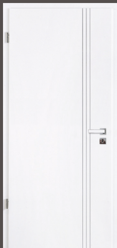
Türblatt mit 3 Längsrillen Lack ähnl. RAL 9010, Rundkante Zarge Weißlack ähnl. 9010 CPL mit 2 mm Designkante