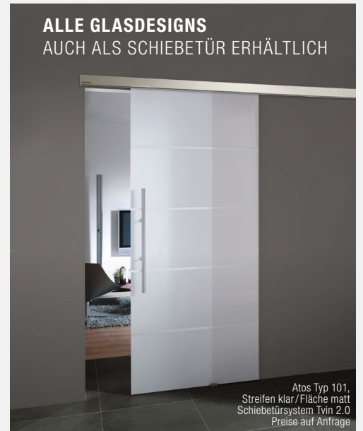
Atos Typ 101, Streifen klar / Fläche matt Schiebetürsystem Tvm 2.0 Preise auf Anfrage

Alle Preise in Euro inkl. ges. MwSt. ohne Zarge und ohne Beschlag | Aktions-Sonderpreise Ganzglas-Drehtüren gilt für Abmessung 834 x 1972 mm