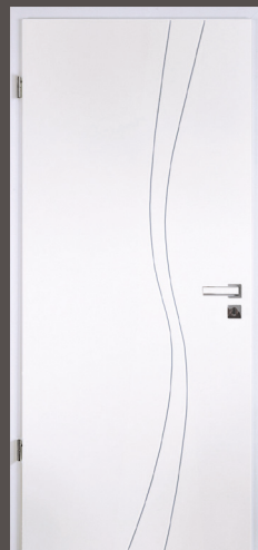
Türblatt mit 2 geschwungenen Längsrillen, Lack ähnl. RAL 9010, Rundkante, Zarge Weißlack ähnl. 9010 CPL mit 2 mm Designkante