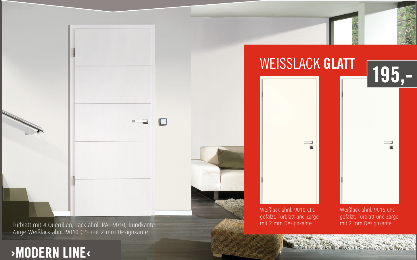
Türblatt mit 4 Querrillen, Lack ähnl. RAL 9010, Rundkante Zarge Weißlack ähnl. 9010 CPL mit 2 mm Designkante