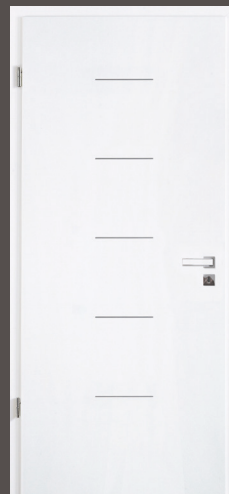
Türblatt mit 5 mittig angeordneten Querrillen, Lack ähnl. RAL 9010, Rundkante Zarge Weißlack ähnl. 9010 CPL mit 2 mm Designkante